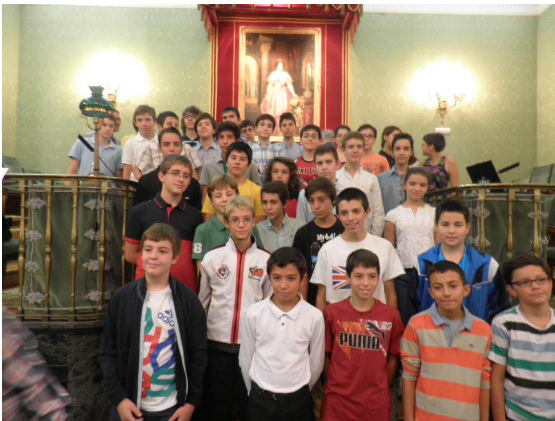
Alumnos del Proyecto Estalmat-Madrid tras finalizar el acto de inauguración

Al acto asistieron los participantes en el Proyecto, tanto en su primer como en su segundo año, así como familiares y amigos. Fue el prelude de las actividades que se realizaron durante todo el año.