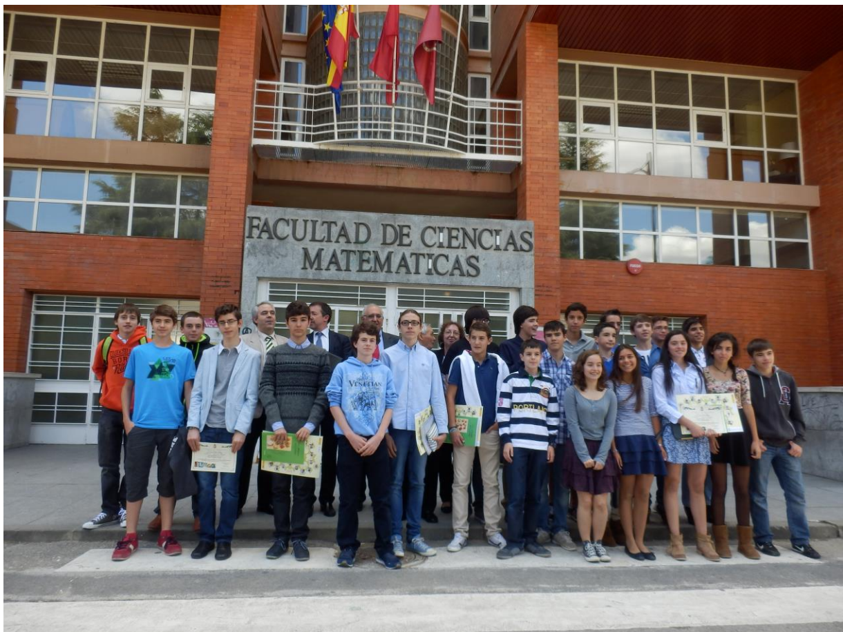
Fotografía de los alumnos de la décimo quinta promoción de Estalmat-Madrid, junto con los profesores, al finalizar la entrega de diplomas

A este acontecimiento asistieron todos los alumnos y alumnas de la promoción 2012-14 junto con sus familiares. A continuación se realizó la tradicional fotografía de los alumnos y alumnas con los Profesores del Proyecto a la puerta de la Facultad de Matemáticas.