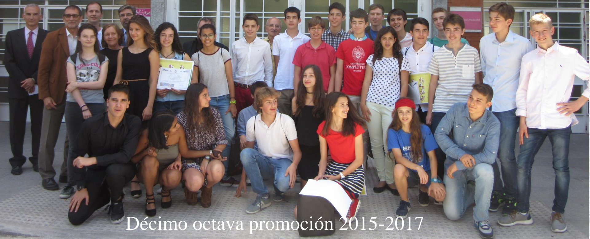
Décimo octava promoción 2015-2017