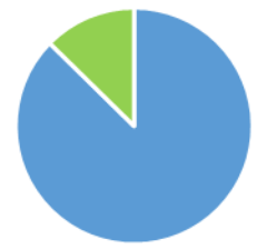
Año de Nacimiento